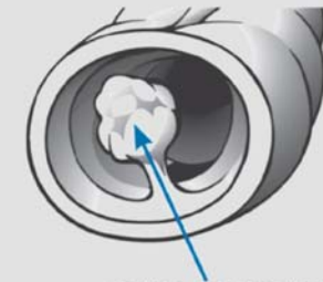
polipo en el colon